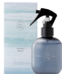
クロニー インプロキアミスト ST (洗い流さないヘアトリートメント)