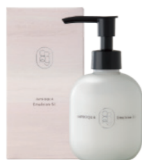
クロニー インプロキアエマルジョン SI (ヘアトリートメント)