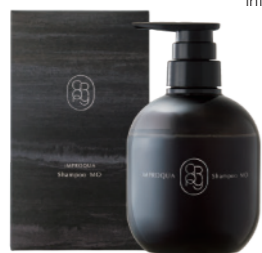
クロニー インプロキアシャンプー MO