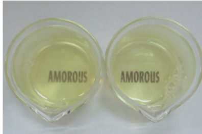
左、右:アルブミンたんぱく

アルブミンたんぱくをビーカーに40mLずつとり、アミノコラーゲンシャンプーとラウレス硫酸Na水溶液を1mLずつ滴下し、10分間放置する。